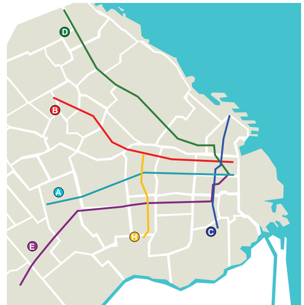
líneas del metro (subte)