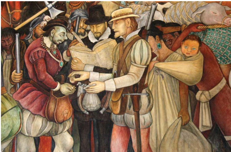
Mural de Diego Rivera en el Museo Regional Cuauhnáhuac (Palacio de Cortés), muestra a Hernán Cortés con La Malinche y su hijo Martín, símbolo del primer mexicano. Aquí Hernán paga tributo a la iglesia.

La civilización más grande de la región _____ ( ser ) la de los Aztecas con su capital en Tenochtitlán, a tres horas de camino en un terreno difícil. Montezuma II, jefe de los aztecas en ese momento y sus hombres _____ ( recibir ) a Hernán como a dioses. Les _____ ( enviar ) regalos de todo tipo, hasta 20 mujeres. Una de ellas _____ ( ser ) la Malinche, una princesa muy inteligente que _____ ( comenzar ) a ser la intérprete de Hernán. También le _____ ( dar ) un hijo que _____ ( ser ) el símbolo del primer mexicano, mezcla de español e indígena.