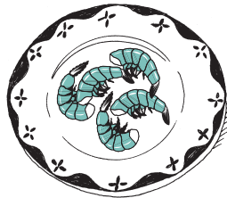
las gambas/ los camarones