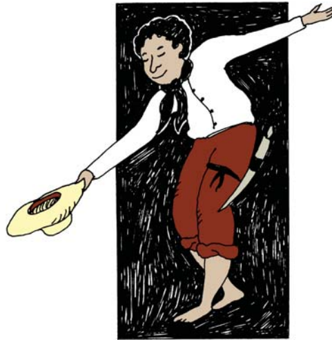
Él baila cumbia, es colombiano.